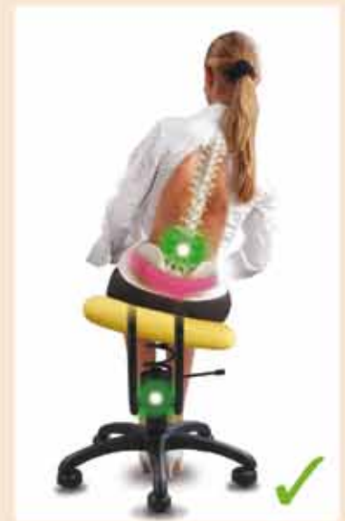
Chaise SpinaliS protège la santé

Depuis bien longtemps médecins et orthopédistes conseillent aux personnes souffrant du dos, l'assise et les exercices sur une balle orthopédique. Cela les oblige à une position assise correcte et renforce les muscles dorsaux et abdominaux. S'asseoir sur une chaise SpinaliS est comparable à s'asseoir sur une balle thérapeutique.