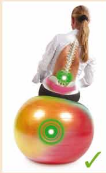
Balle orthopédique protège la santé

L'assise passive sur le siège fixe d'une chaise ergonomique occasionne des maux et lésions au dos dû à la pression irrégulière sur les disques intervertébraux. La colonne vertébrale 'craque' dans la partie faible du dos à chaque mouvement, occasionnant des lésions et des douleurs.