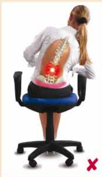
Chaise ergonomique mal au dos

L'assise passive sur le siège fixe d'une chaise ergonomique occasionne des maux et lésions au dos dû à la pression irrégulière sur les disques intervertébraux. La colonne vertébrale 'craque' dans la partie faible du dos à chaque mouvement, occasionnant des lésions et des douleurs.