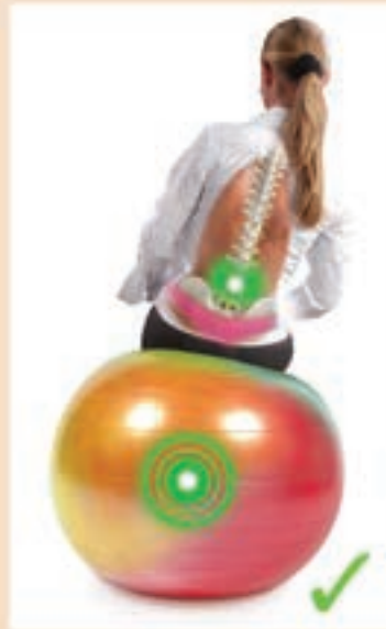
Balle orthopédique protège la santé

L'assise passive sur le siège fixe d'une chaise ergonomique occasionne des maux et lésions au dos dû à la pression irrégulière sur les disques intervertébraux. La colonne vertébrale 'craque' dans la partie faible du dos à chaque mouvement, occasionnant des lésions et des douleurs.