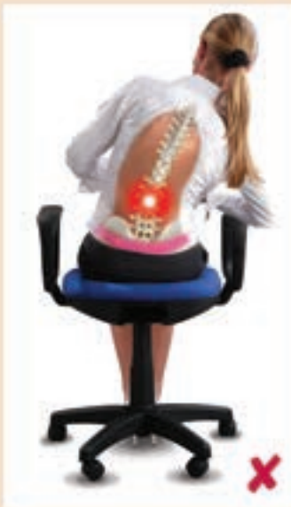
Chaise ergonomique mal au dos

L'assise passive sur le siège fixe d'une chaise ergonomique occasionne des maux et lésions au dos dû à la pression irrégulière sur les disques intervertébraux. La colonne vertébrale 'craque' dans la partie faible du dos à chaque mouvement, occasionnant des lésions et des douleurs.